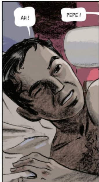
TATOUAGE : "JE SUIS NÉ POUR RÉVOLUTIONNER L'ENFER."