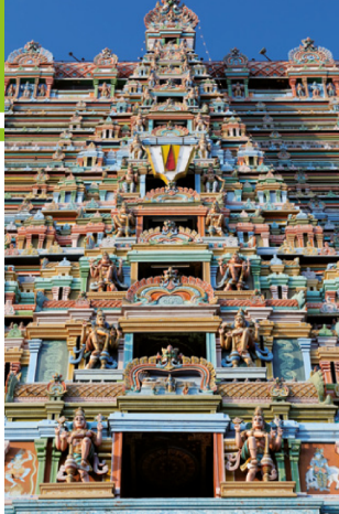
Temple Srirangam à Trichy.