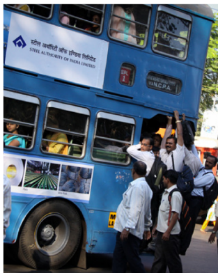
Les bus à impériale, héritage du Raj britannique, Mumbai.

le pays tout entier à la mi-juillet. La deuxième vague de pluies frappe le Tamil Nadu vers la fin du mois de novembre et au début de décembre. La meilleure période pour visiter l'Inde va d'octobre à mars et les deux meilleurs mois pour visiter le Sud sont janvier et février.