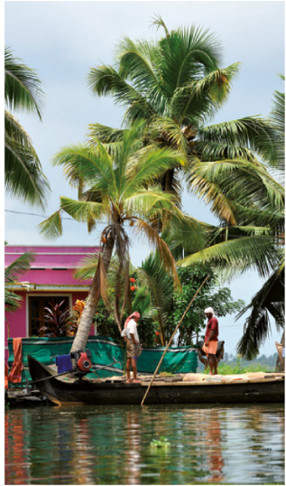
Chargement de la récolte du riz dans les Backwaters.

N'hésitez pas non plus à goûter les fameux masala dosa , des crêpes de lentilles agrémentées de légumes, notamment de pommes de terre : c'est un plat simple, mais très apprécié des Occidentaux. La richesse de la côte en poissons augmente encore les possibilités de choix à l'heure des repas, la pêche du jour étant exposée à l'extérieur des restaurants.