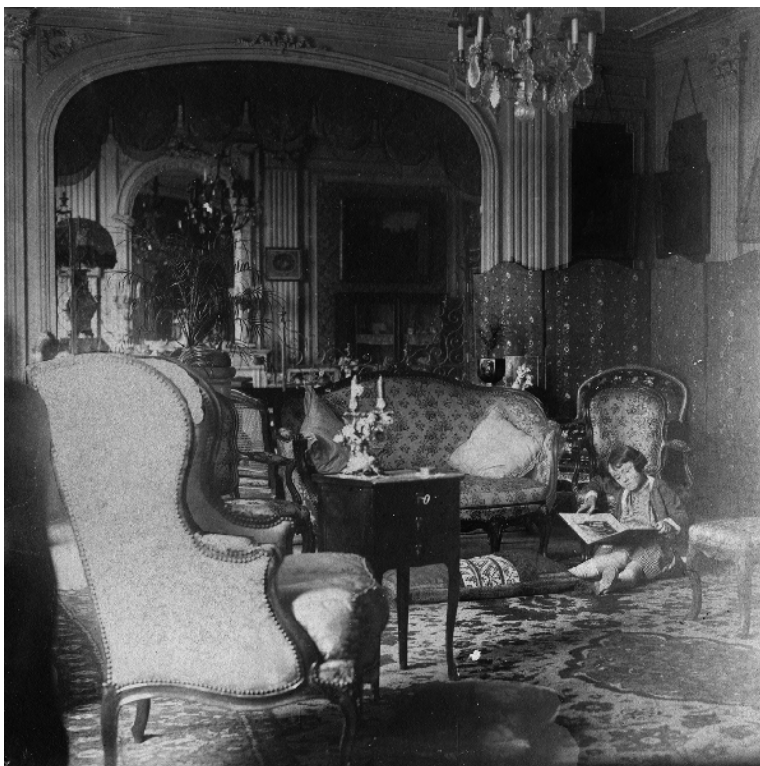
Catherine Dior en train de lire dans l'appartement parisien de la famille, vers 1922.