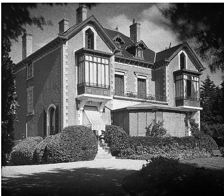
Les Rhumbs, maison familiale des Dior, à Granville, sur la côte normande.