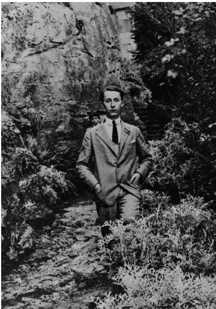
Christian Dior dans le jardin des Rhumbs.