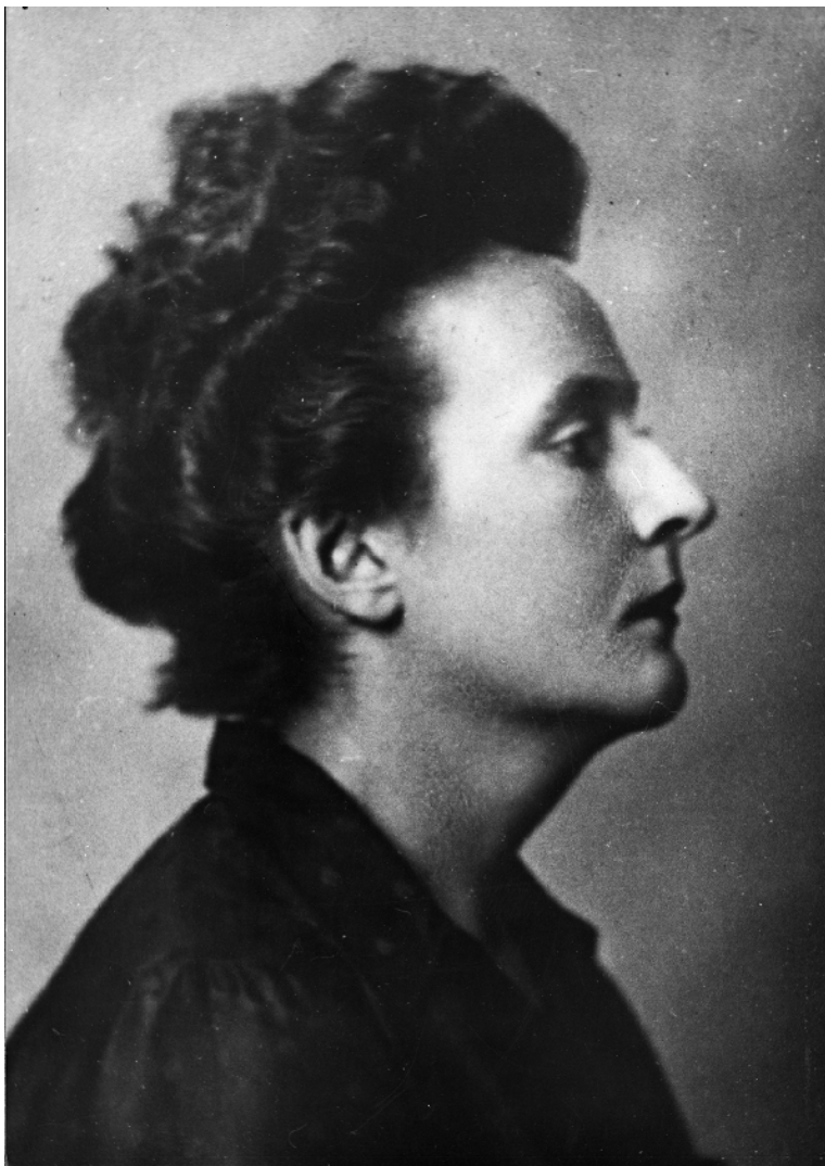
Catherine Dior à trente ans, en 1947.