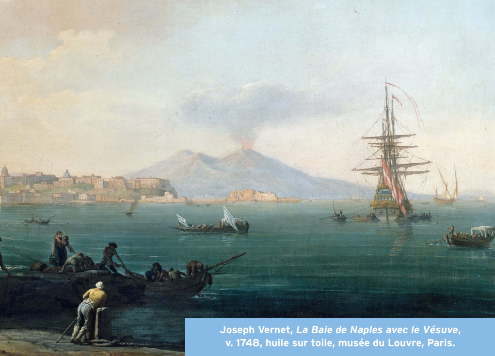
Joseph Vernet, La Baie de Naples avec le Vésuve , v. 1748, huile sur toile, musée du Louvre, Paris.

HYACINTE, fille de Géronte, et amante d'Octave.