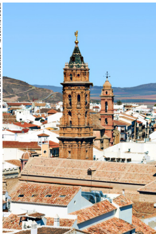
Le village d'Antequera.