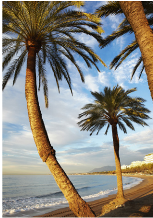
La plage de Fontanilla au soleil couchant.

Les chiffres parlent d'eux-mêmes et l'on trouve ici un climat généreux pour les amateurs de soleil, avec pour Malaga le chiffre de 2 846 heures d'ensoleillement par an. Seule petite précaution à prendre, le mois de mars est parfois pluvieux.