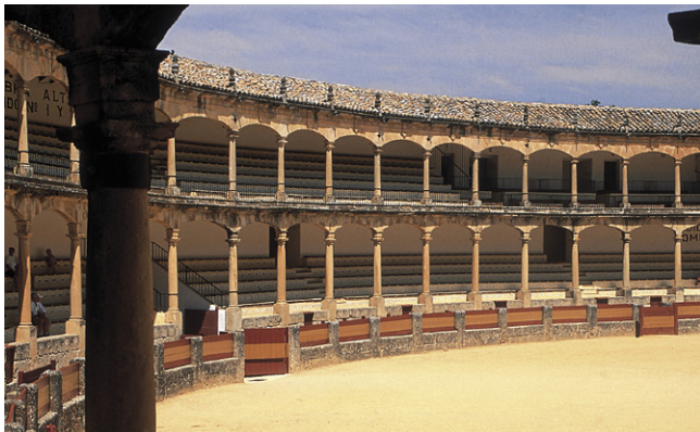
Arènes de Ronda.

C'est au flamenco et à la sévillane du siècle dernier que les castagnettes doivent leur grande popularité ; aujourd'hui elles sont beaucoup moins utilisées pour les spectacles.