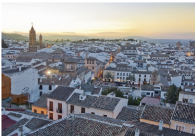
Ville de Antequera.

Avec plus de 300 jours de soleil par an, cette costa de 161 km 2 qui longe la province de Málaga, d'Estepona à Nerja, mérite pleinement son nom. Climat idéal presque toute l'année, longues étendues de plages, bleu idyllique de la mer, destinations phare comme Marbella, Torremolinos ou Nerja et soirées trépidantes, voilà quelques-uns des attraits qui ont fait la réputation de la Costa del Sol et l'ont transformée depuis longtemps en l'un des hauts lieux du tourisme en Europe. Avoir été l'une des toutes premières destinations dédiée sol y playa n'a pas été sans laisser de traces sur l'urbanisation des côtes ; cependant, en faisant quelques pas de côté, on pourra toujours y dénicher son petit paradis, un peu plus isolé. Mais c'est surtout un magnifique point de départ pour découvrir l'arrière-pays ou la région de l'Axarquía et ses nombreux pueblos blancos qu'incarne parfaitement Frigiliana. On partira ainsi sur la trace de la présence maure dans la province de Málaga, mais on pourra aussi s'immerger dans la ville natale de Picasso et profiter de son impressionnante offre en termes de musées ou encore découvrir la splendeur de Ronda et l'ensemble des dolmens d'Antequera désormais classé au patrimoine mondial par l'Unesco. Golf, VTT, voile et plongée sous-marine seront aussi au menu des plaisirs. Sans oublier les stars des chiriguitos de bord de plage et leurs espetos , sardines grillées, à déguster sans modération, accompagnées, bien sûr, d'un verre de Malaga.