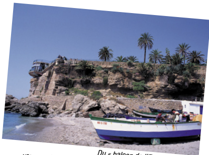
Du « balcon de l'Europe » à Nerja, vous profiterez de magnifiques points de vue sur le littoral.

Avec plus de 300 jours de soleil par an, cette costa de 161 km 2 qui longe la province de Málaga, d'Estepona à Nerja, mérite pleinement son nom. Climat idéal presque toute l'année, longues étendues de plages, bleu idyllique de la mer, destinations phare comme Marbella, Torremolinos ou Nerja et soirées trépidantes, voilà quelques-uns des attraits qui ont fait la réputation de la Costa del Sol et l'ont transformée depuis longtemps en l'un des hauts lieux du tourisme en Europe. Avoir été l'une des toutes premières destinations dédiée sol y playa n'a pas été sans laisser de traces sur l'urbanisation des côtes ; cependant, en faisant quelques pas de côté, on pourra toujours y dénicher son petit paradis, un peu plus isolé. Mais c'est surtout un magnifique point de départ pour découvrir l'arrière-pays ou la région de l'Axarquía et ses nombreux pueblos blancos qu'incarne parfaitement Frigiliana. On partira ainsi sur la trace de la présence maure dans la province de Málaga, mais on pourra aussi s'immerger dans la ville natale de Picasso et profiter de son impressionnante offre en termes de musées ou encore découvrir la splendeur de Ronda et l'ensemble des dolmens d'Antequera désormais classé au patrimoine mondial par l'Unesco. Golf, VTT, voile et plongée sous-marine seront aussi au menu des plaisirs. Sans oublier les stars des chiriguitos de bord de plage et leurs espetos , sardines grillées, à déguster sans modération, accompagnées, bien sûr, d'un verre de Malaga.