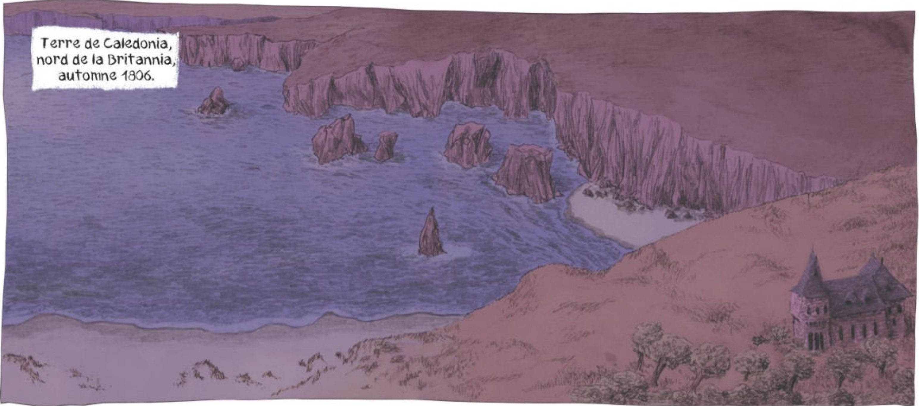
Terre de Caledonia, nord de la Britannia, automne 1806.