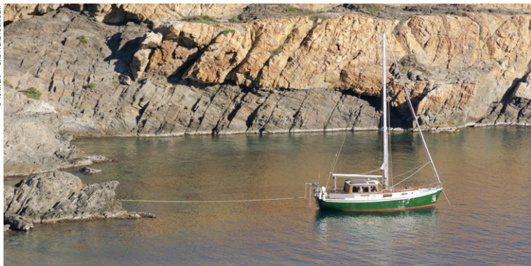
Bateau dans le Cap de Creus.