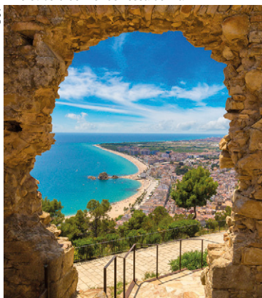
Vue d'ensemble du littoral et de la ville de Blanes.