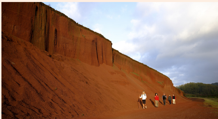
Randonnée vers le Volcan du Croschat.