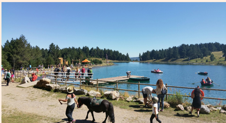
Lac de La Molina.