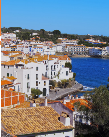
Vue sur Cadaqués.