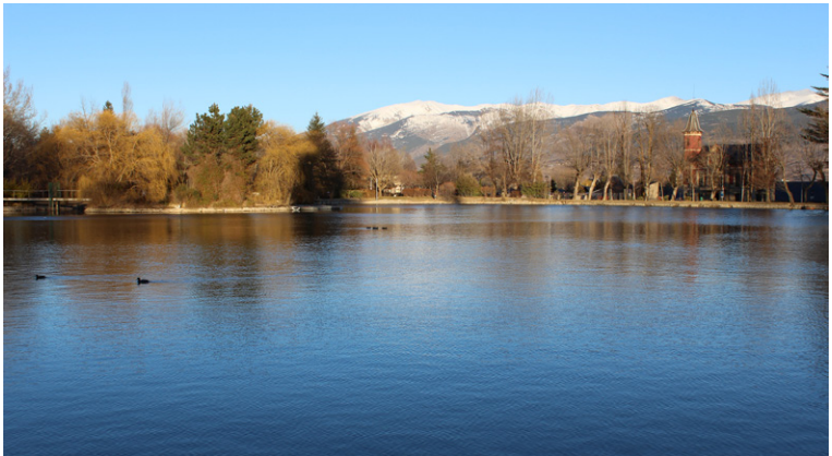
Lac de Puigcerdà.

Sur la Costa Brava, mais plus encore dans les Pyrénées de Gérone, les amateurs de vieilles pierres et du Moyen Âge en prendront plein les mirettes. Le patrimoine roman de la région est tout bonnement stupéfiant, tant par le nombre d'édifices millénaires que par la très bonne conservation de leur structure originale. Outre la Cathédrale de Gérone, les monastères de Ripoll et de Sant Joan de les Abadesses, une myriade d'églises, de sanctuaires, de chapelles et d'ermitages, plus ou moins facilement accessibles, émaillent le territoire, chaque village prenant soin de son héritage. Nous conseillons, à ceux qui cherchent à percer les mystères de ces premiers temples chrétiens, de louer les services d'un guide spécialisé. Ne reste plus qu'à s'équiper de bonnes chaussures et de plonger dans ce lointain passé les yeux grands ouverts.