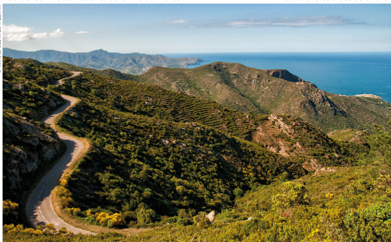
Paysage montagneux du Cap de Creus.