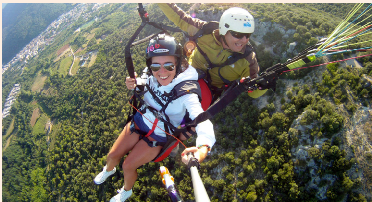
Parapente au-dessus de Amer.