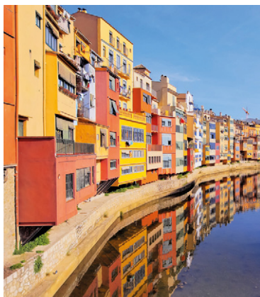
Habitations colorées de Girona.