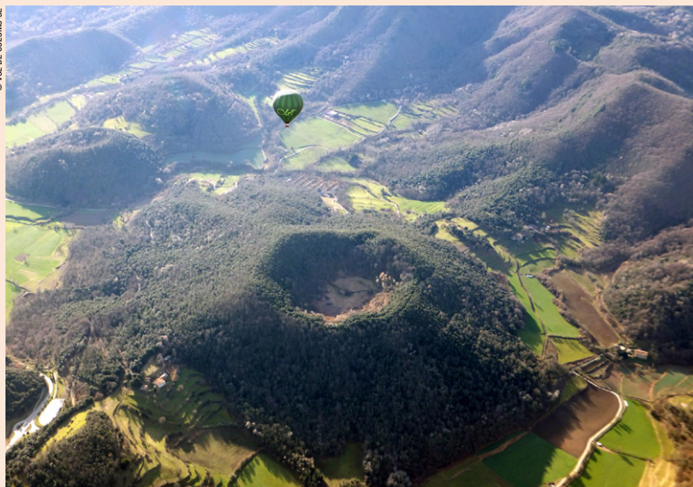
Survol du volcan de Santa Margarida.