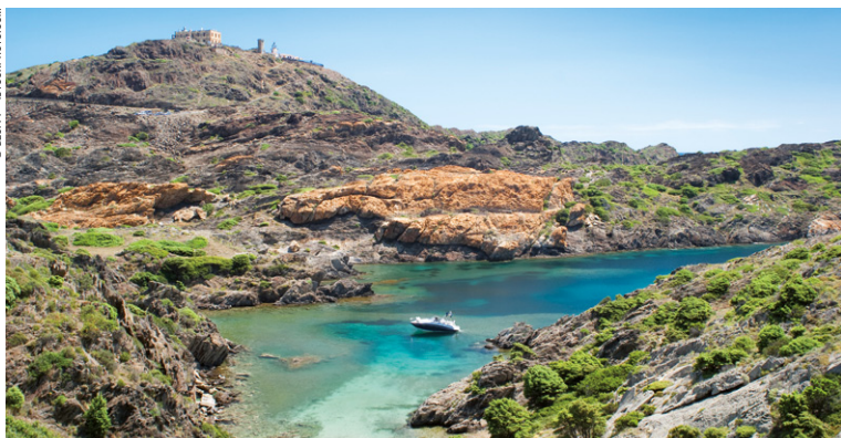
Cap de Creus.