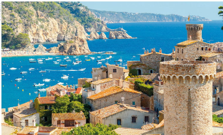
Ville et bord de mer de Tossa de Mar.