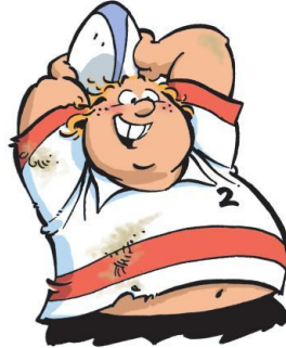
Jérôme LENCLUME dit LOUPIOTE (car ce n'est pas une lumière)

Aussi affamé de victoires que de repas d'après-match !