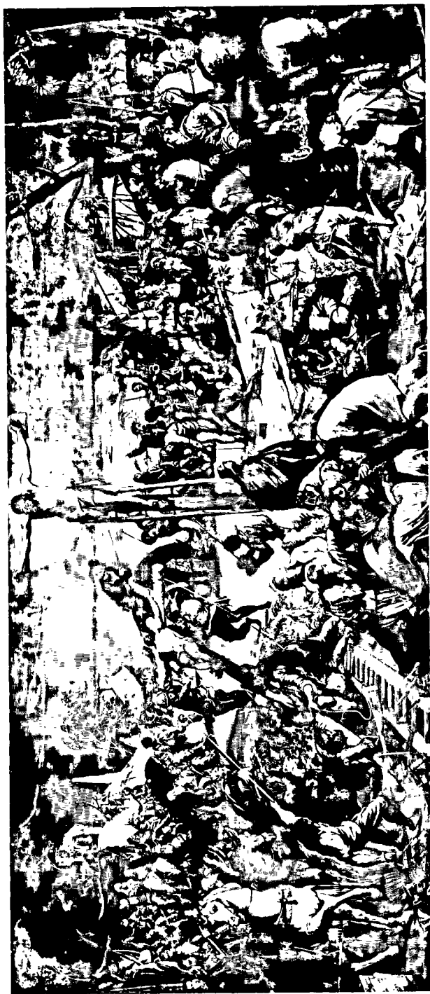
Le Tintoret, Crucifixion . Scuola di San Rocco, Venise.