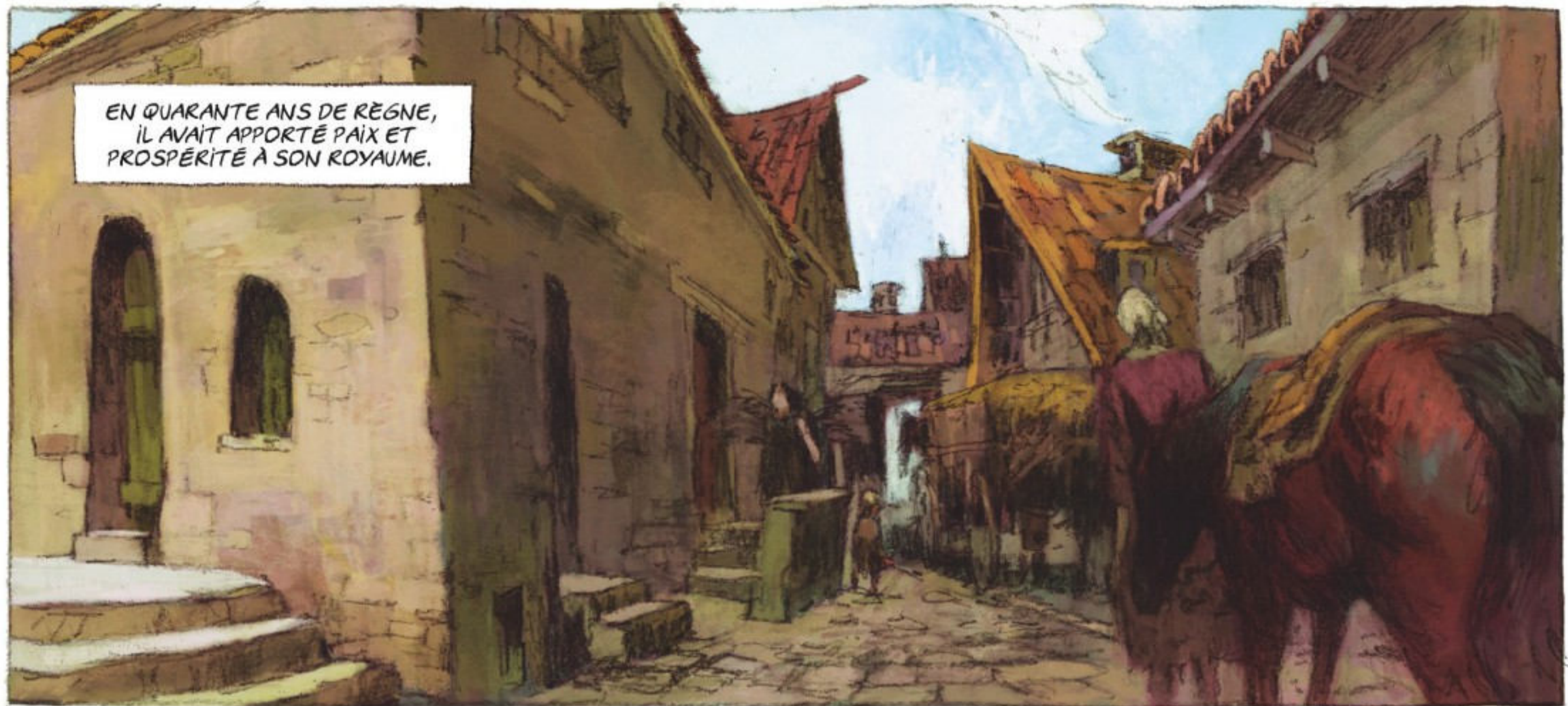
EN QUARANTE ANS DE RÈGNE, IL AVAIT APPORTÉ PAIX ET PROSPÉRITÉ À SON ROYAUME.