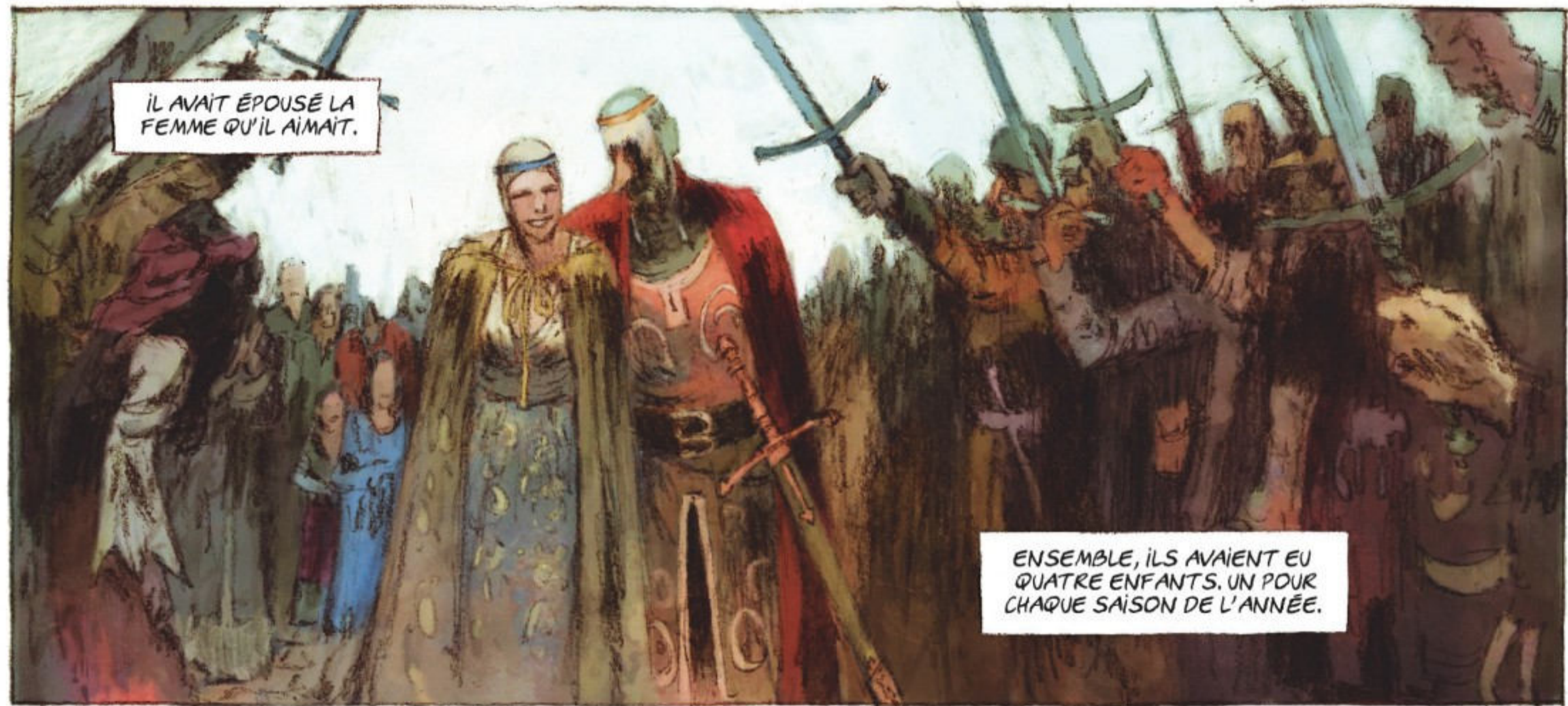
IL AVAIT ÉPOUSÉ LA FEMME QU'IL AIMAIT.