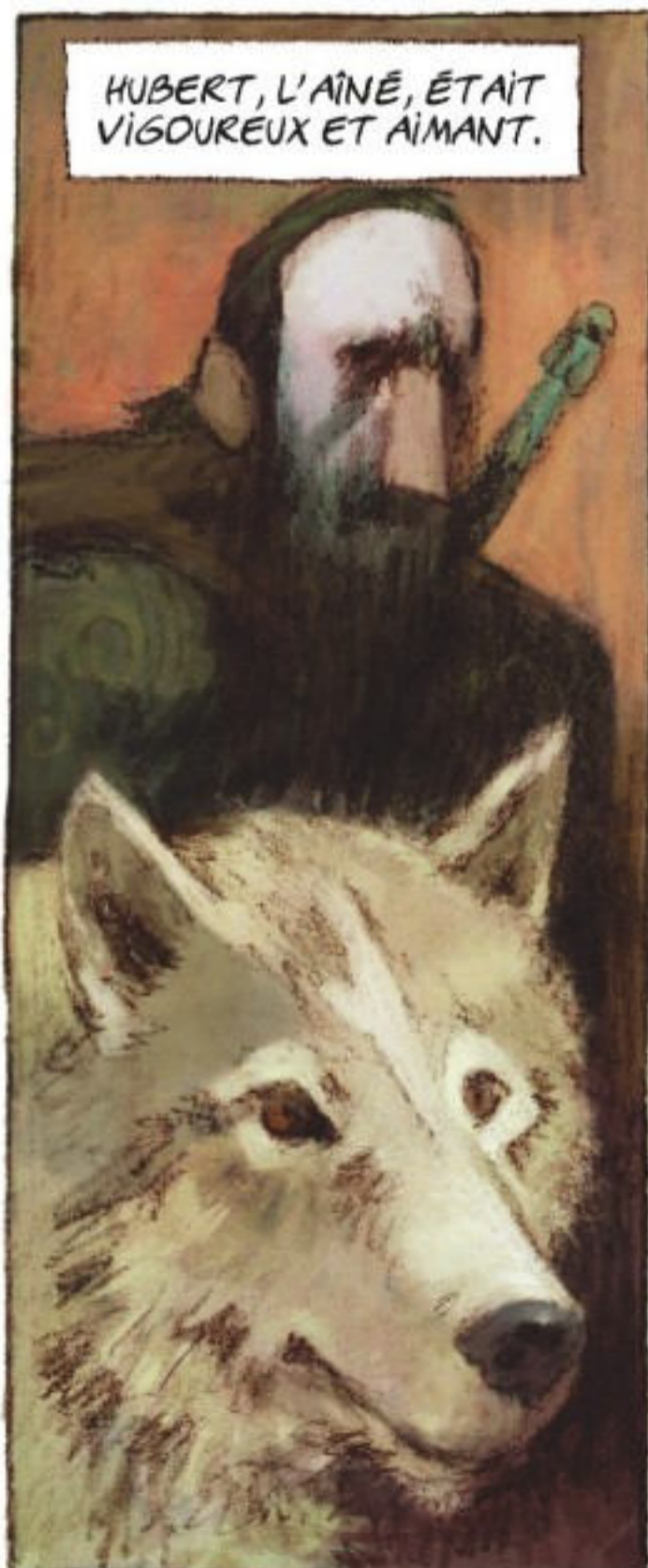
HUBERT, L'AÎNÉ, ÉTAIT VIGOUREUX ET AIMANT.