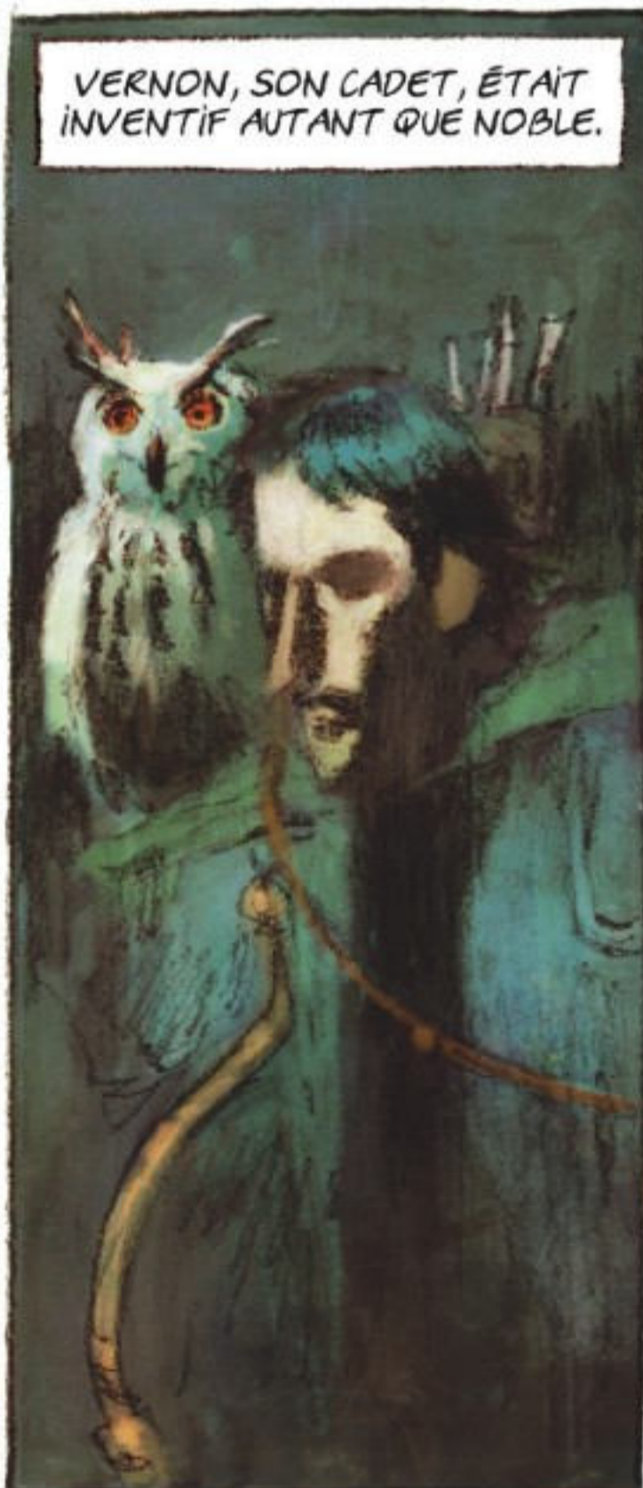
VERNON, SON CADET, ÉTAIT INVENTIF AUTANT QUE NOBLE.