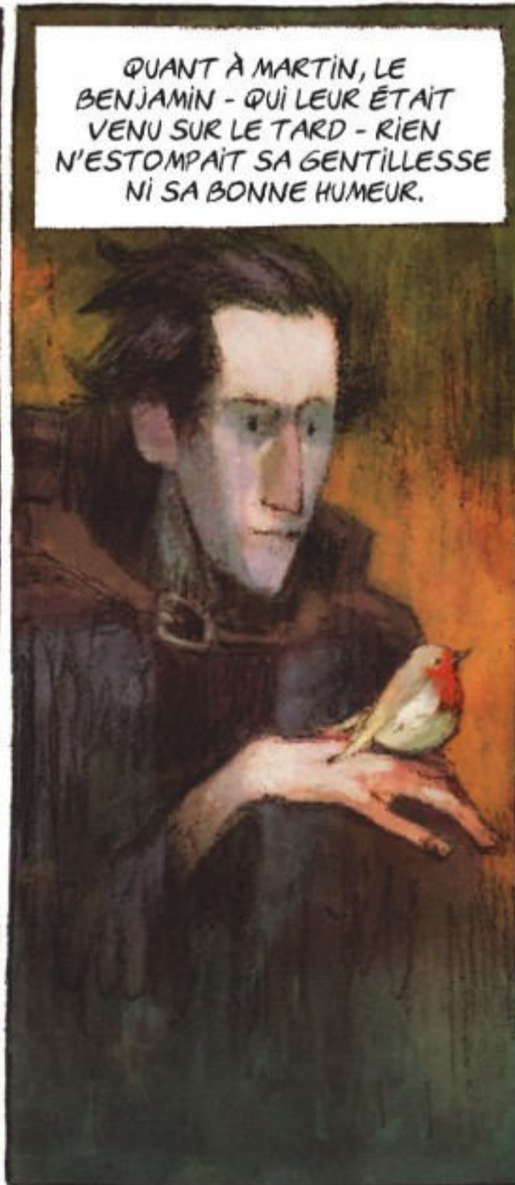
QUANT À MARTIN, LE BENJAMIN - QUI LEUR ÉTAIT VENU SUR LE TARD - RIEN N'ESTOMPAÏT SA GENTILLESSE NI SA BONNE HUMEUR.