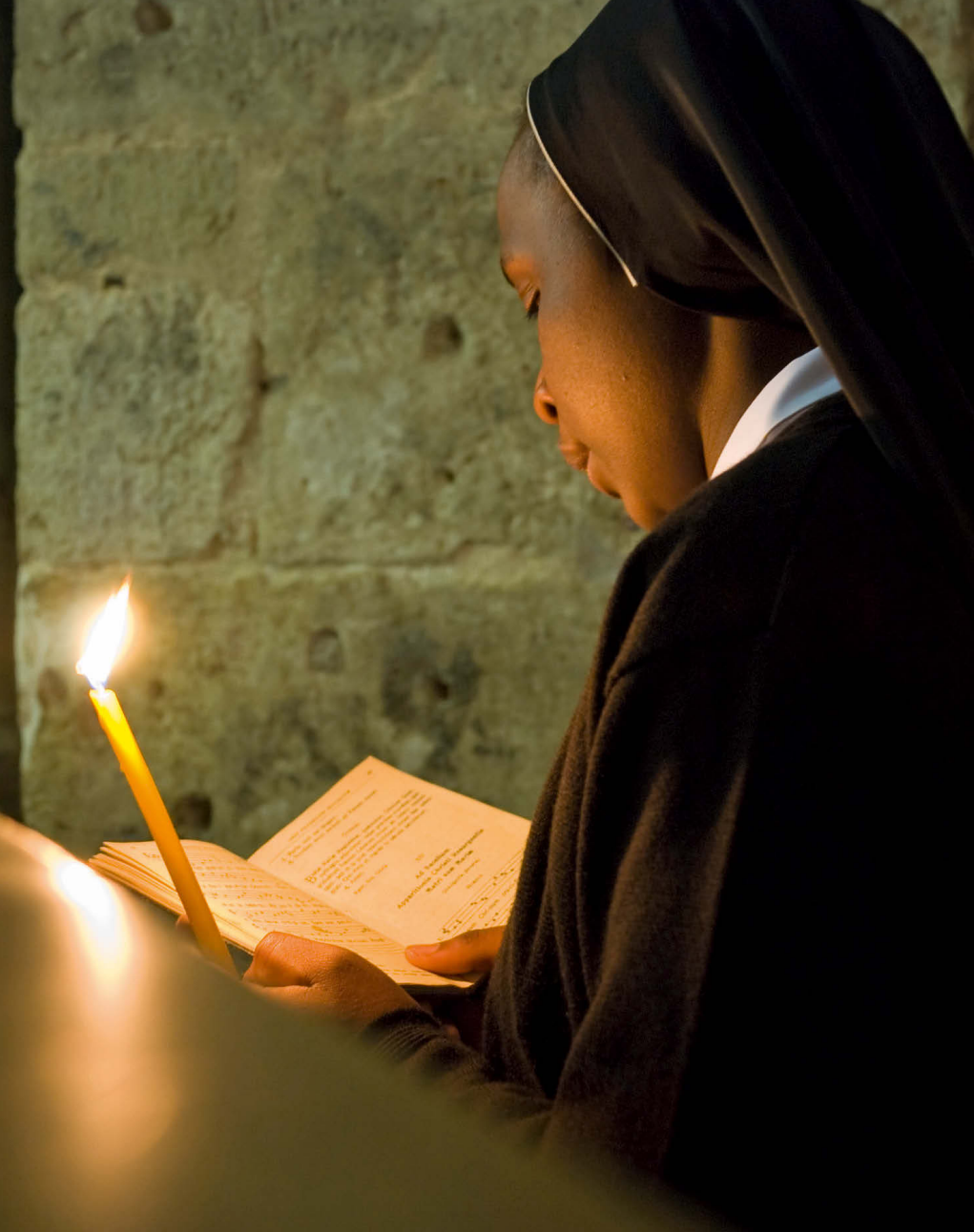
Joel Carillet, Religieuse , 2011, photographie.