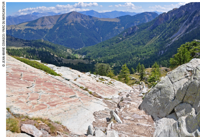
Vallée des Merveilles, sentier dit « la voie sacrée ».