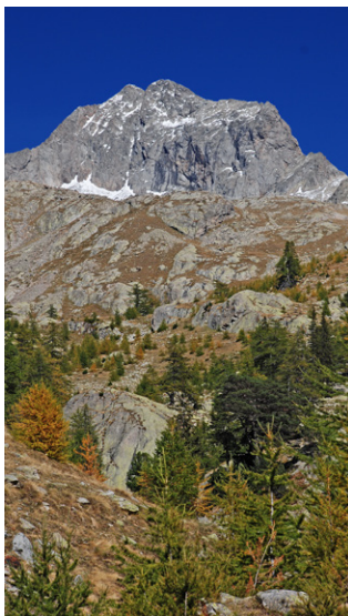
Le sommet du Gélas.