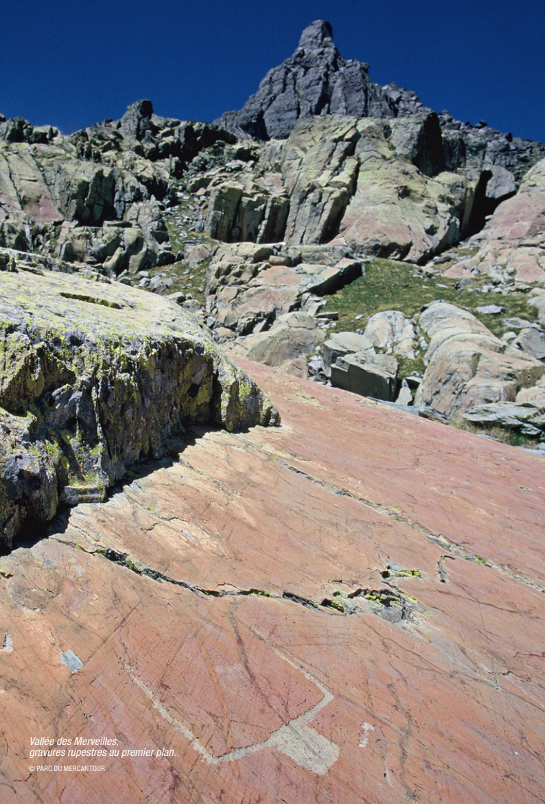
Vallée des Merveilles, gravures rupestres au premier plan.