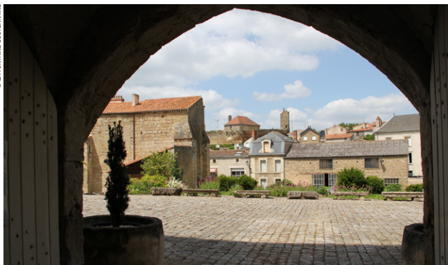
Airvault, Petite Cité de Caractère en vallée du Thouet.