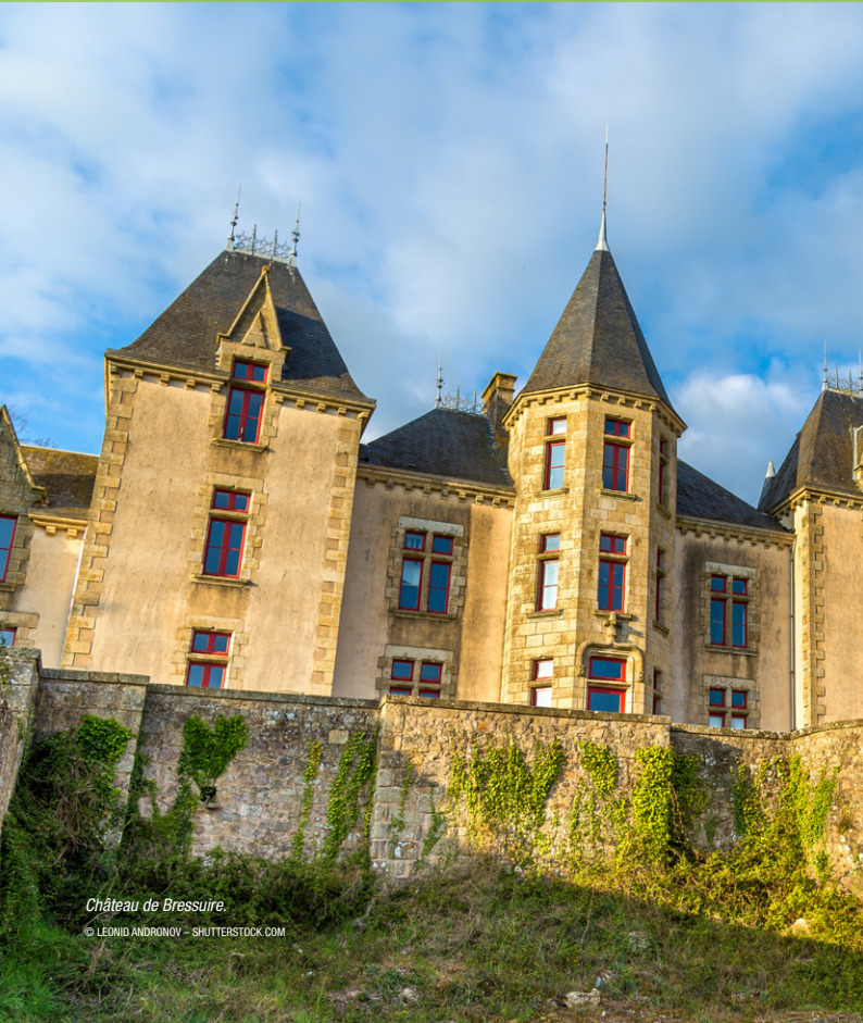
Château de Bressuire.