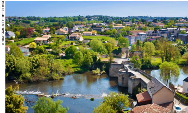
La vallée du Thouet à Thouars.

► Forêts et bois : les Deux-Sèvres sont un pays particulièrement verdoyant. Outre le Marais poitevin et ses labyrinthes sans fin, de nombreux bois et forêts, dont la forêt de Chizé, vestige d'une forêt préhistorique avec ses grandes futées de chênes et de