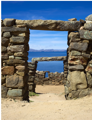
Site archéologique de Tiwanaku.