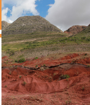
Les couleurs du parc national Toro Toro révèle différentes ères au grand jour.