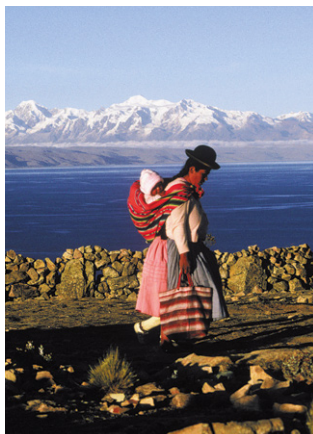
Île du Soleil, lac Titicaca.

On peut voyager en Bolivie toute l'année. Mais, d'une manière générale, il pleut