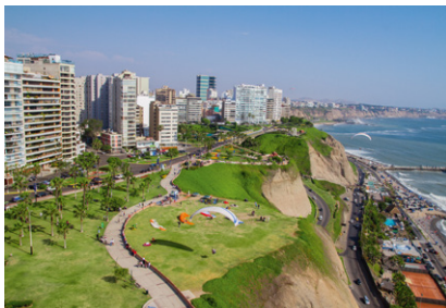
Survol de Lima.