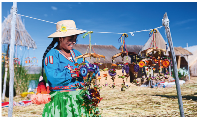
Vendeuse d'objets décoratifs sur les îles du lac Titicaca.

7 heures de plus en France qu'au Pérou en été et 6 heures en hiver (ex : quand il est midi à Lima, il est 19h à Paris en été et 18h en hiver).