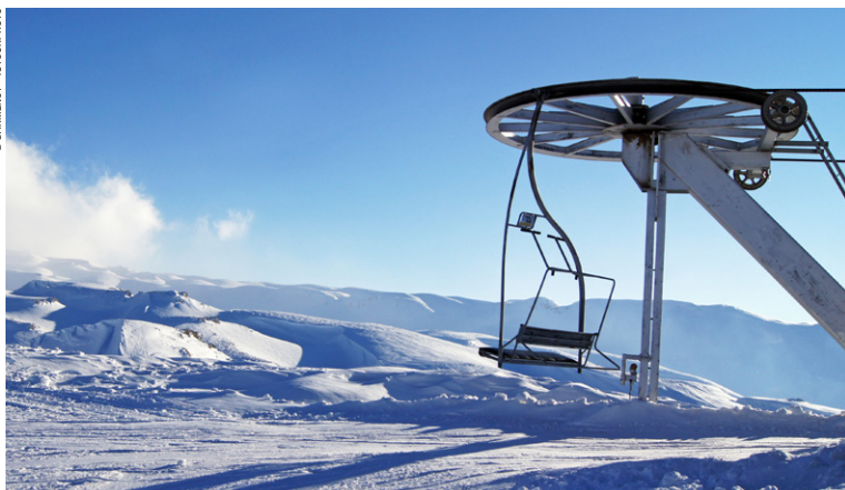
Piste de ski de Faraya au Liban.