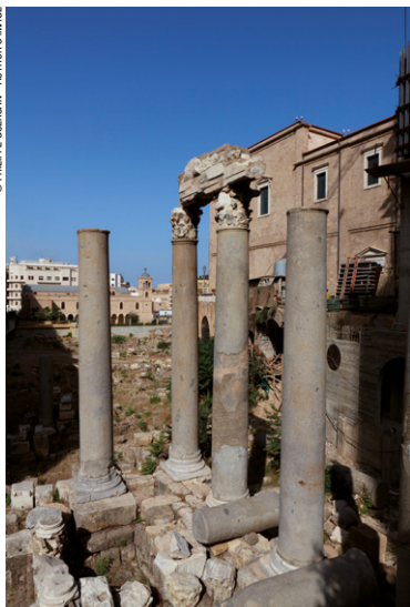
Site archéologique du vieux Beyrouth.