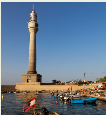
La corniche et le nouveau phare.