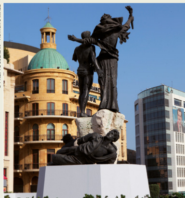
Statue des Martyrs sur la place du même nom.