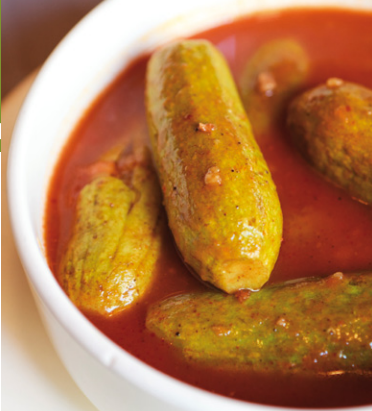
Les courgettes fourrées sont au menu dans la cuisine traditionnelle libanaise.