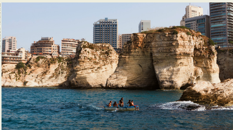
La grotte aux Pigeons.