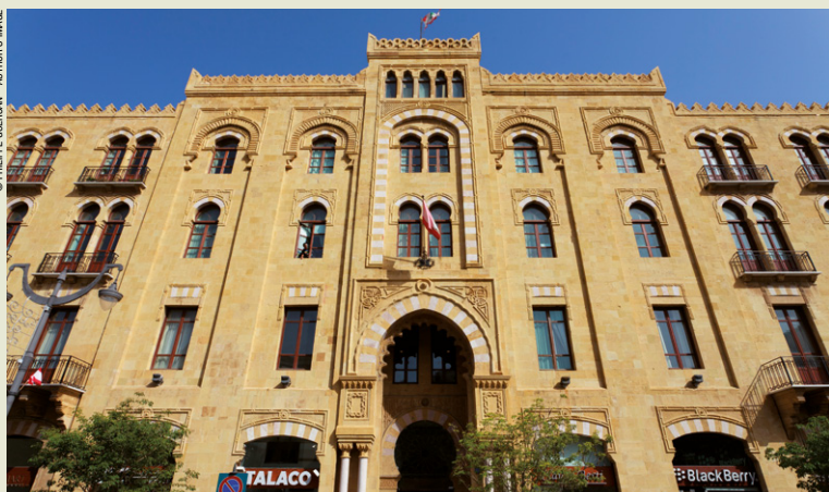
Municipalité de Beyrouth.

► De France au Liban : vers un poste fixe, composer le 00 + 961 + indicatif de la