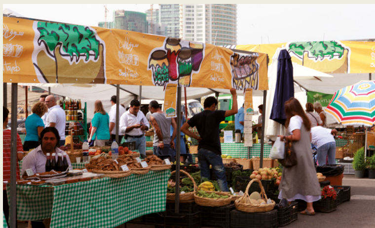
Souk el-Tayeb, premier marché bio du Liban.