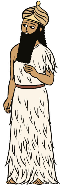
ENLIL, dieu des Vents, maître de la Forêt des Cèdres