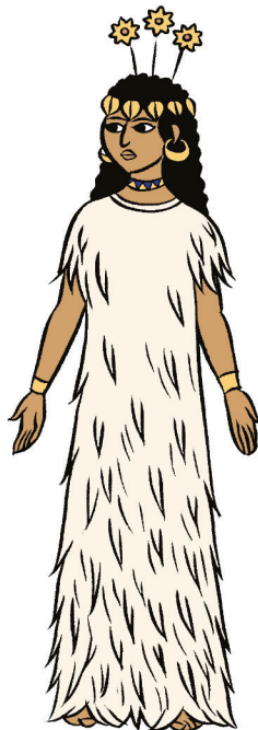
NINSOUNA, déesse des Buffles, mère de Gilgamesh