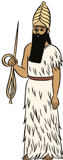
SHAMASH, dieu Soleil