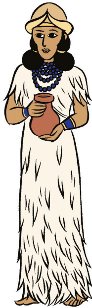
AROÛROÛ, Grande déesse Mère