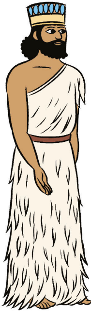
ANOÛ, dieu du Ciel