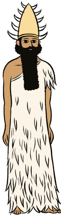
ÉA, dieu des Eaux Douces Souterraines