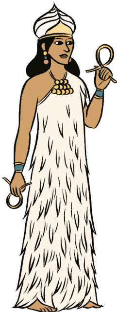
ISHTAR, déesse de l'Amour et de la Guerre