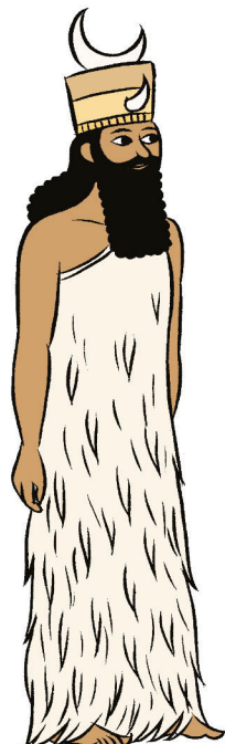
SIN, dieu Lune