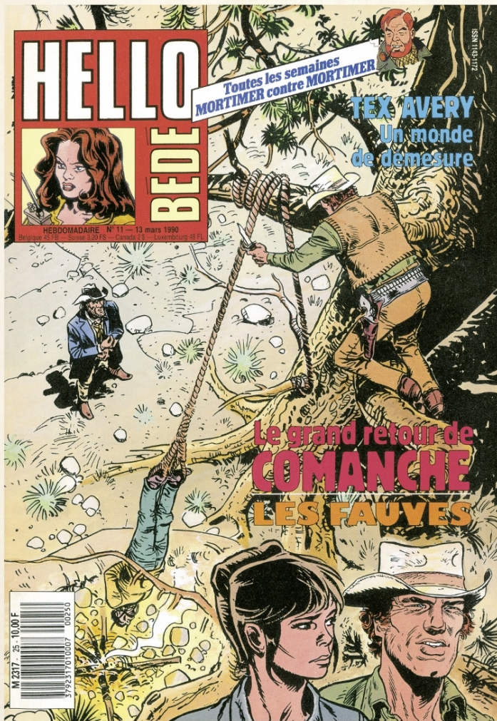
Comanche version Michel Rouge en couverture de la revue HelloBédé n° 25 (n° 11 en Belgique) parue le 13 mars 1990.