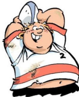
Jérôme LENCLUME dit LOUPIOTE (car ce n'est pas une lumière)

Aussi affamé de victoires que de repas d'après-match !