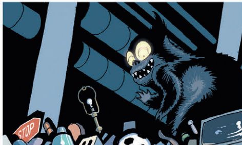
Marcus le troll avec son magot, dans un endroit tenu secret.

Quand j'ai emménagé à Écho City, j'ai été HORRIFIÉ d'apprendre qu'un énorme troll vivait dans notre sous-sol. Kevin, mon nouveau copain, m'a dit d'appeler Margo Maloo. Au début, ça m'a CHOQUÉ de voir que Margo allait laisser le troll dans notre sous-sol, mais j'ai fini par comprendre que Marcus est une créature raffinée (doublée d'un excellent joueur de Soldanimos). J'ai été l'assistant de Margo sur d'autres affaires, ce qui m'a entraîné dans BEAUCOUP de recoins sombres d'Écho City.