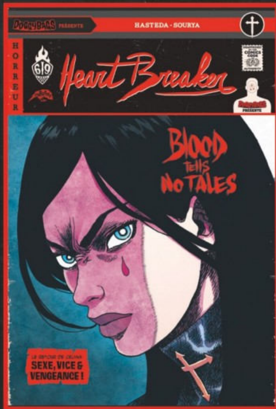
"BLOOD TELLS NO TALES" PAR HASTEDA & SOURYA