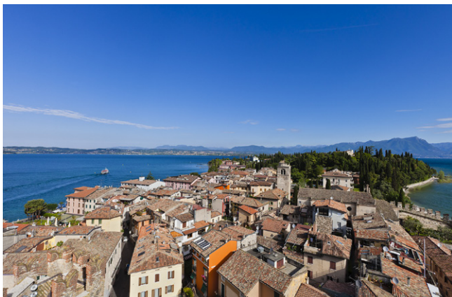
Péninsule de Sirmione et lac de Garde.

► Taux de chômage : 9,7 % en Italie ; 6 % en Lombardie.