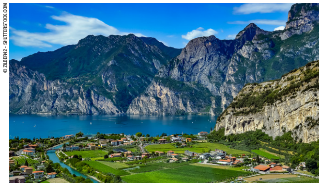
Vue sur le lac de Garde et sur la ville de Riva del Garda.

Eau, nature, art et gastronomie, tels sont les ingrédients d'un séjour réussi sur les Grands Lacs. Festivals, manifestations, marchés et parcs d'attraction, aussi bien du côté des grandes villes comme Milan et Vérone que dans les localités lacustres sont autant d'événements et de distractions de qualité qui attirent touristes et