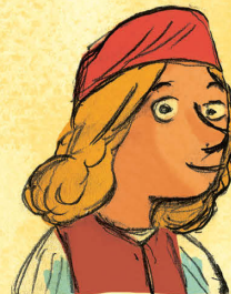
Et moi, Léonard