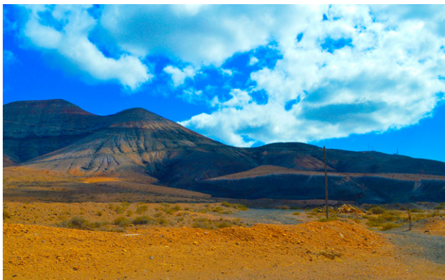
Paysages volcaniques sur la route de Lajares.

Quand il est midi à Paris et à Madrid, il est 11h aux Canaries.