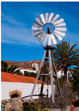
Fuerteventura est balayée par les alizés.