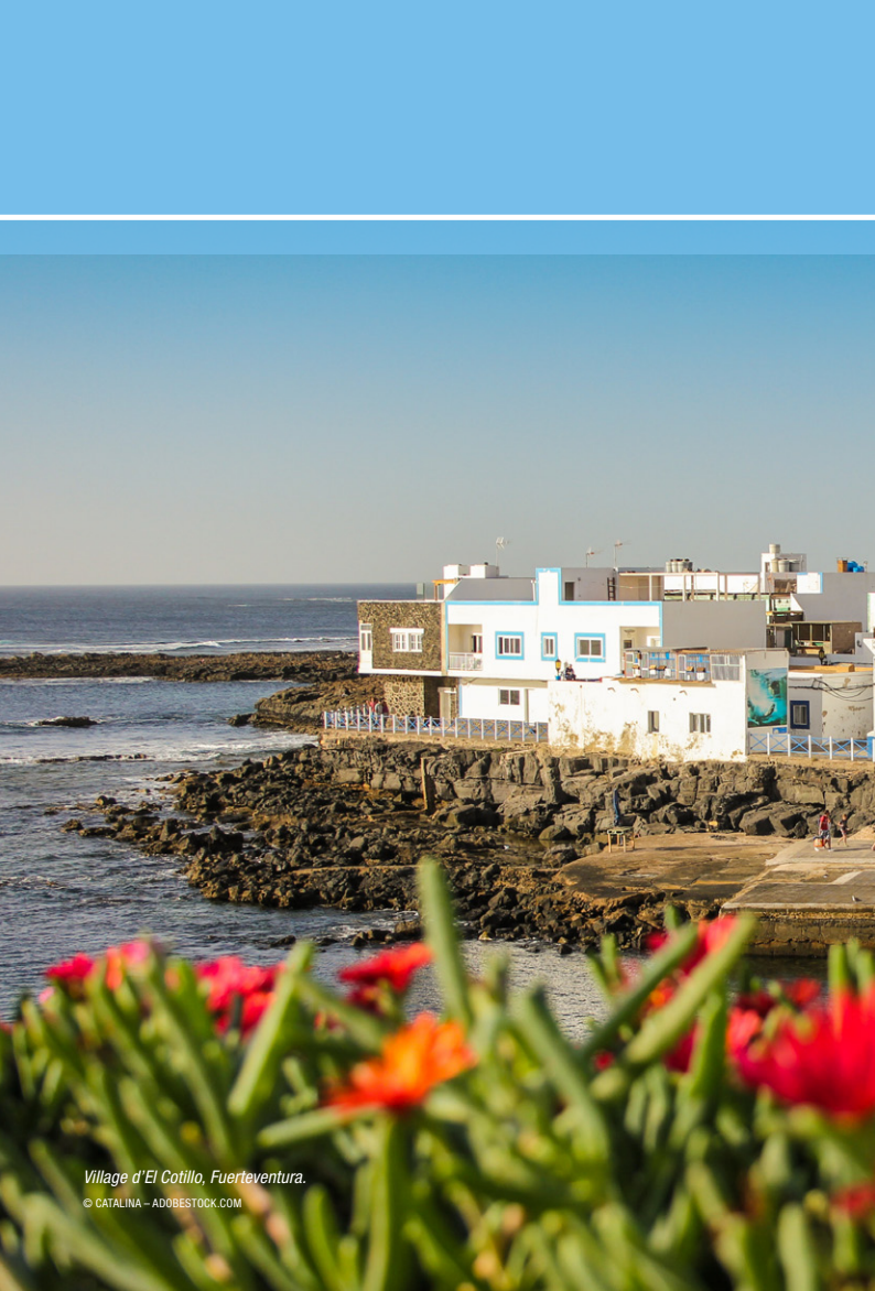
Village d'El Cotillo, Fuerteventura.