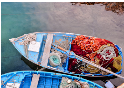
Bateau de pêche, El Cotillo.