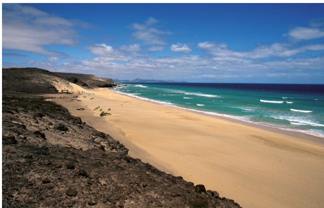
Plage de Tierra Dorada.

Il y a une heure en moins par rapport à la France et au reste de l'Espagne. Le changement d'heure d'hiver et d'été s'effectue aux mêmes dates qu'en France.